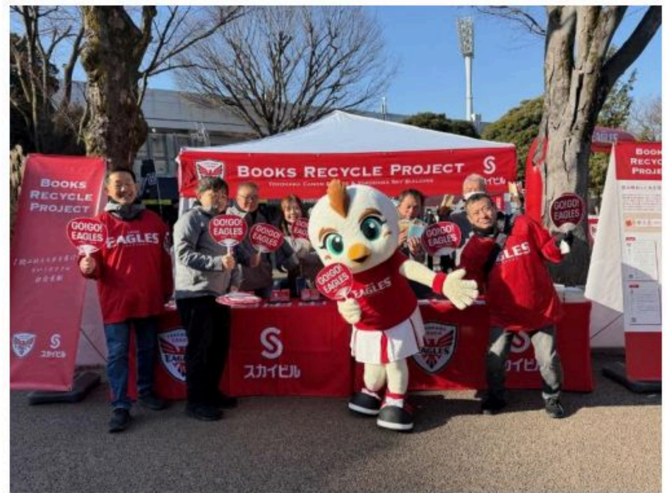
※試合会場 実施風景